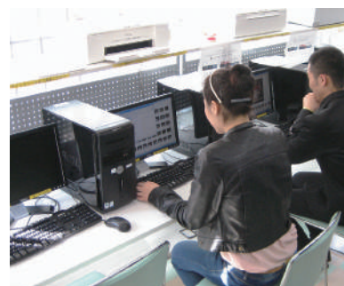
上左:日中学院一楼大厅 上右:电化教室 下左:图书室 下右:学生专用电脑及打印机