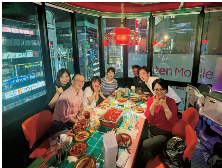
双方向交流のリハーサル（老师和同学们）

また、日中学院の中でもたくさんの出会いがあります。級友と一緒に食事したり、旅行へ行ったりしました。年代も職業もさまざまな人と中国語という共通の興味を通じて繋がるができます。外国語を学ぶことで自分の世界も広がるとともに、相手の世界も広げられると心から思います。ぜひ始めてみてください。そして始めたら、続けてみてください。きっと人生が豊かになるはずですから。