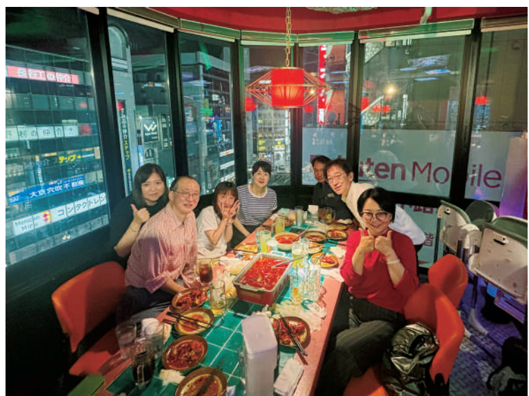
双方向交流のリハーサル (老师和同学们)

また、日中学院の中でもたくさんのお会いがあります。級友と一緒に食事したり、旅行へ行ったりしました。年代も職業もさまざまな人と中国語という共通の興味を通じて繋がることができます。外国語を学ぶことで自分の世界も広がるとともに、相手の世界も広げられると心から思います。ぜひ始めてみてください。そして始めたら、続けてみてください。きっと人生が豊かになるはずですから。