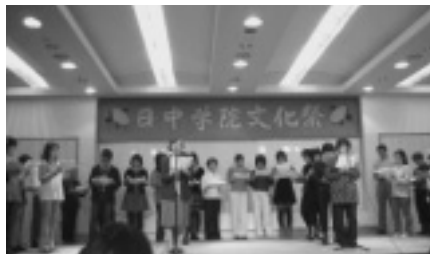
校友会「ピースリーディング」