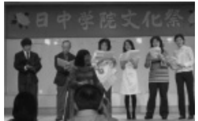
校友会合唱クラブ