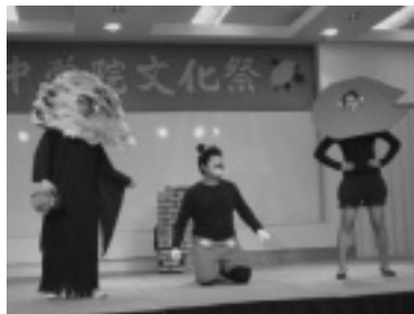
本科2B「ねずみのお嫁さん」