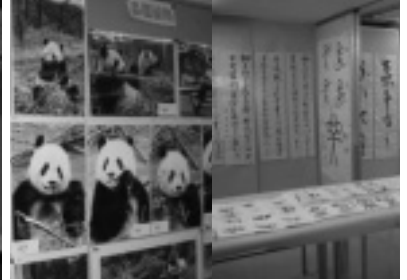
中国写真展／書道展