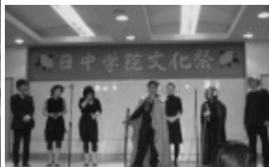
別科朗読大会代表