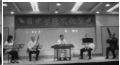
中国民族楽器の合奏