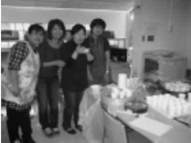
本研「タピオカミルク」