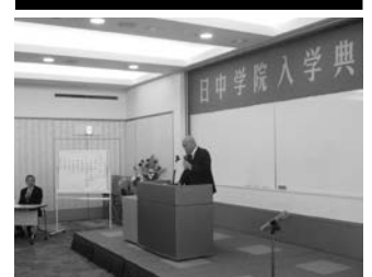
4月5日(金) 本科・日本語科合同入学式